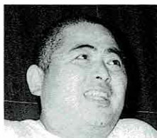
五味ふれあい部会長

短い期間中ですができるかぎり沼津を知ってもらおうと日程作りに精を出す企画広報担当、唯一市民と交流し日本文化にも触れる日の計画を立てる市民交流担当、出会いと別れを演出する歓送迎会担当が活発な意見交換を行った結果、下記のような日程に決定しました。