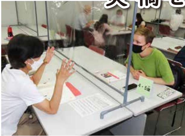
▲にほんご教室 (国際理解教育部会)