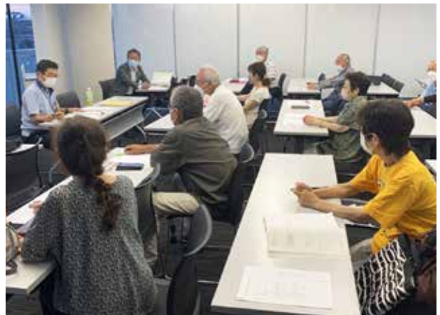
▲定例会 (ふれあい部会)