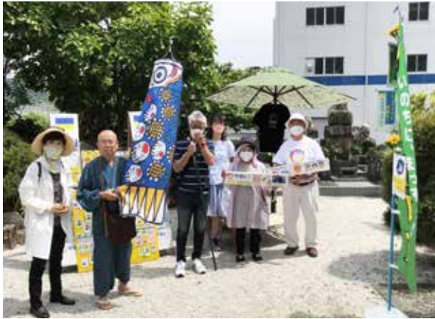
▲ウクライナ人道支援活動

発行日 2022年9月30日 発行者 NICE沼津国際交流協会 (企画広報部会) 所在地 沼津市御幸町16番1号 (事務局) 沼津市役所地域自治課内 ☎055-934-4717 FAX055-931-2606 http://www.nice-numazu.org/