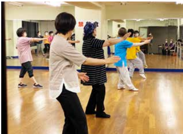
▲太極拳講座 (岳陽部会)