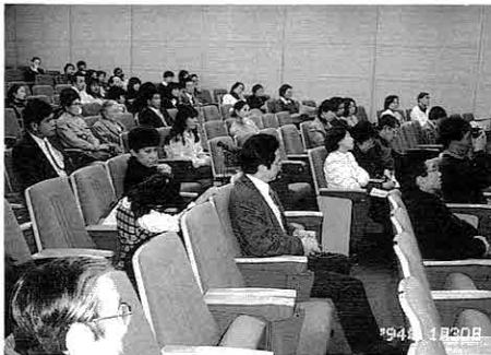
スピーチに聞き入る観客

日本語によるスピーチでは、祖国と日本の文化・風俗習慣の違いや、お互いの交流の必要性、そして沼津に住んでの感想など、それぞれユーモアも交えて発表されました。