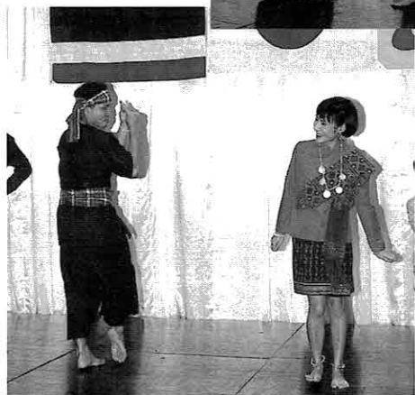
◀ 踊りのステップも軽やかに