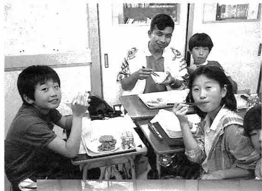
◀小学校で楽しくランチ交流