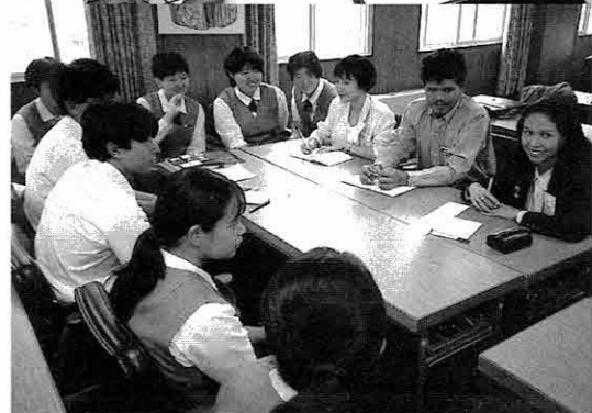
◀高校では生徒とにぎやかに懇談