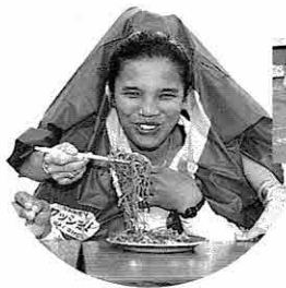
▼抱腹絶倒の二人羽織