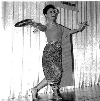
◀ 艶やかな衣装によるタイ舞踊

実際は、ここで言葉では言い尽くせない程の経験をする事ができました。日本の象徴である富士山のように偉大で揺るぎない私たちの友情。この確固たる友情が、タイと日本の、そして人類の発展のために役に立つ事を願っています。