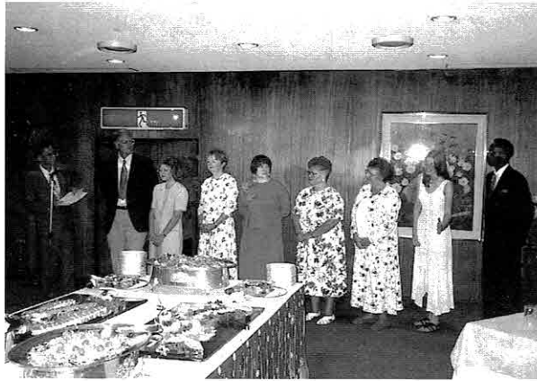
▲沼津ホテルでの歓迎パーティー 空手の模範演技も見せていただきました