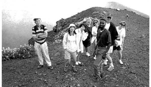
▲富士登山記念 お天気で良かったですね！