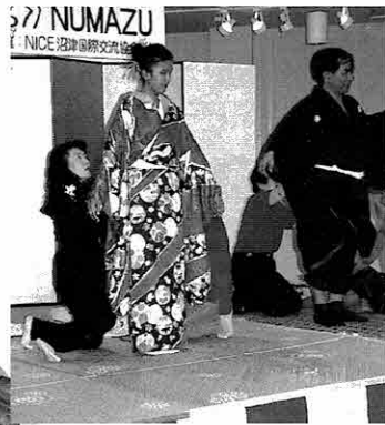
▲和服の着付けを体験