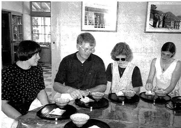
▲御用邸記念公園でのティーセレモニー グリーンティーの味はいかが？