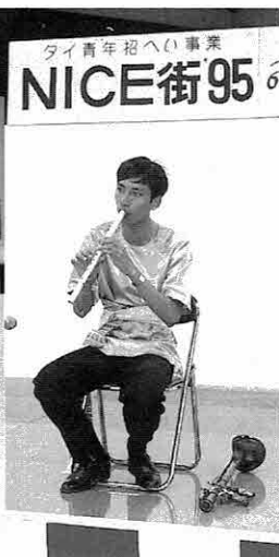
▲伝統楽器、胡弓の演奏