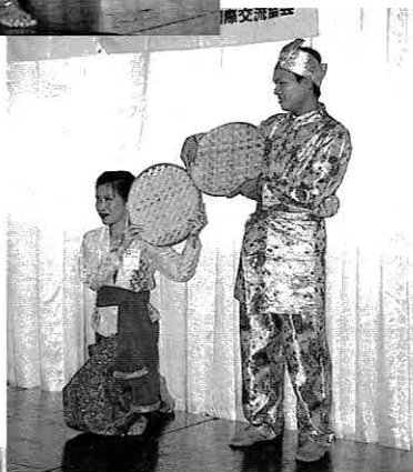
▶ 収穫を祝うタイの踊り