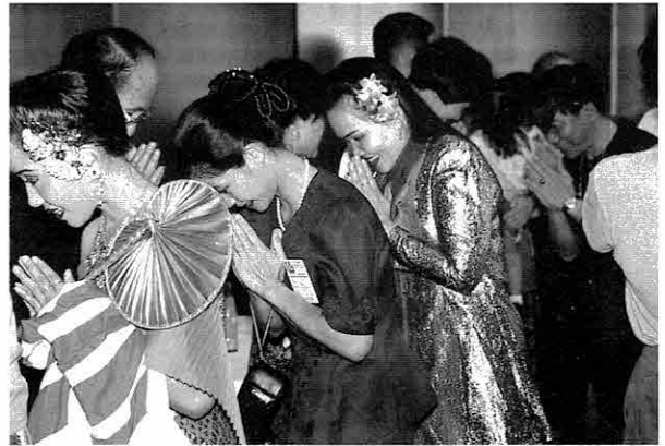
▲「サワディ」の挨拶を交わして入場