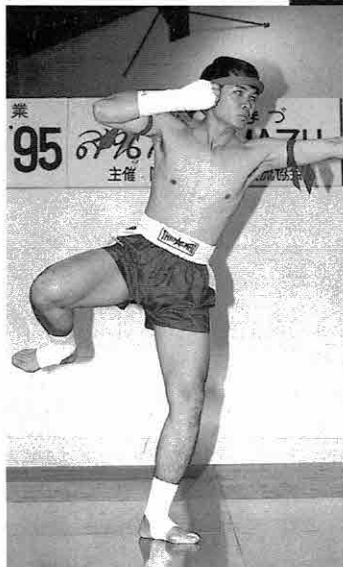
▲神に捧げるタイ式ボクシングの踊り