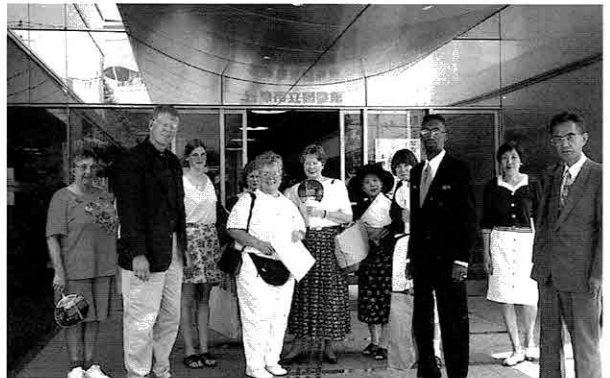
▲市立図書館の見学