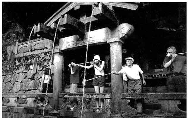
▲京都清水寺で長寿の水を飲むエリザベス