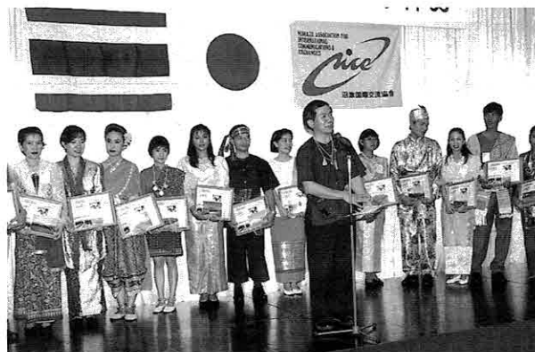
▲「沼津の皆さん、ありがとう」