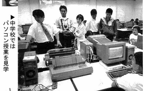
▶中学校ではパソコン授業を見学