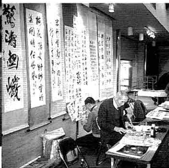
▲中国語と書画に親しむコーナーも新設