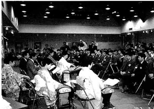
▲NICE会員による琴・尺八演奏