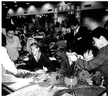
▲NICE会員による華道コーナーには中国人以外の外国人の姿も