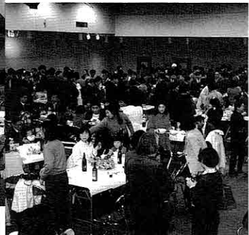
▲会場一杯に咲いた交流の花