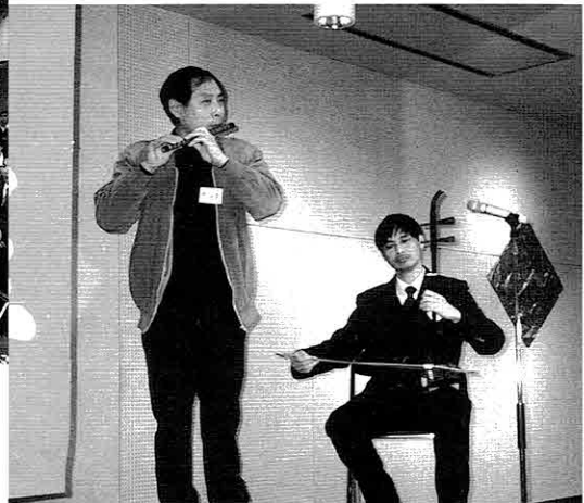
▲市内企業で学ぶ中国人研修生による 笛と胡弓の演奏