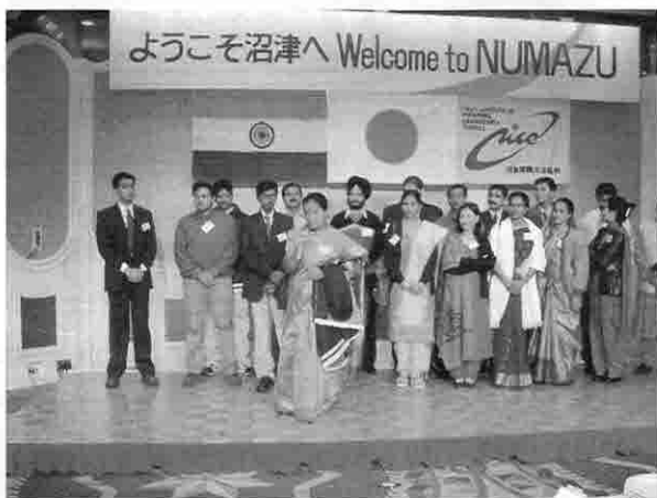
(昨年度のインド青年招聘事業)